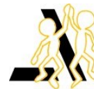
DRIVE, SPIRIT, WOHLFÜHLKULTUR